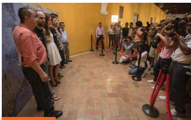
Photocall con los integrantes de la película Operación E