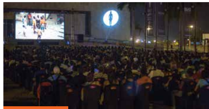
Los rebeldes del fútbol en Cine bajo las Estrellas