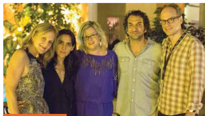
Noche de los Oscars en la casa Quintana