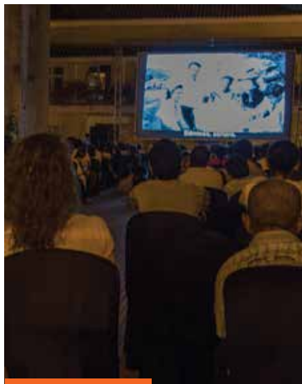
Retrospectiva de De Sica en Plaza de la Proclamación