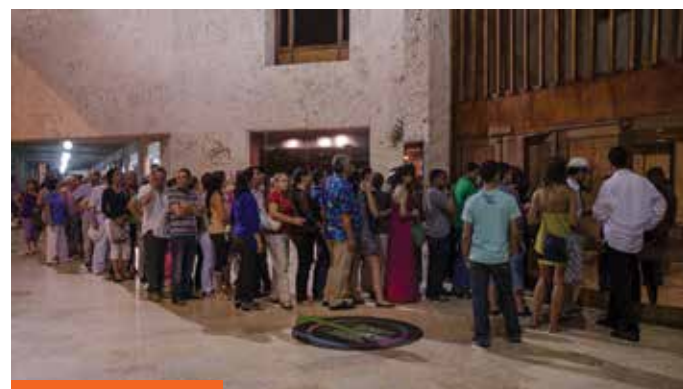
Salas llenas en el FICCI 53