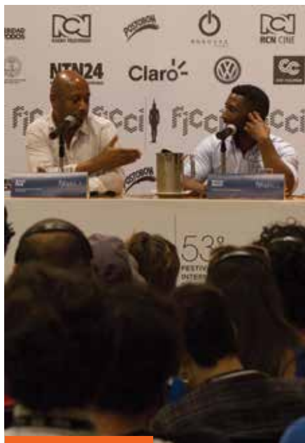
Conversatorio de Raoul Peck y Wesley Morris en Salón FICCI