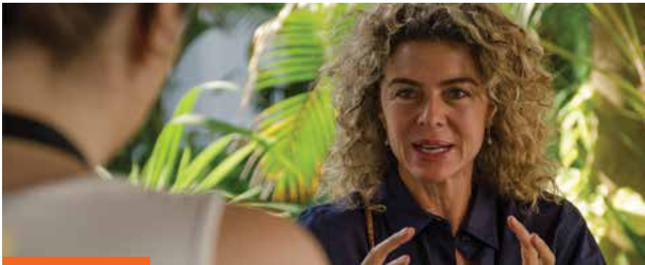
Margarita Rosa de Francisco en entrevista en canal FICCI.