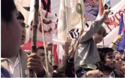
Algunas aristas que distinguen esta gema