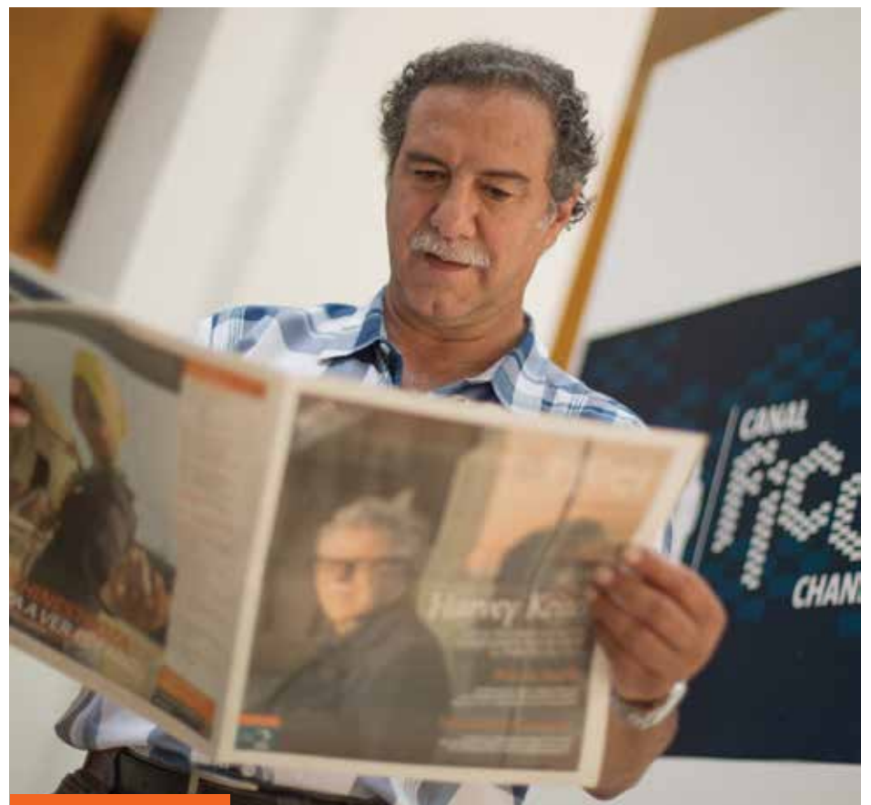
El director Víctor Gaviria viviendo el 53 FICCI.