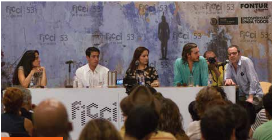
Equipo de "Roa" en conferencia de prensa.