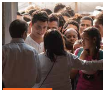
Lleno total en "El Faro".