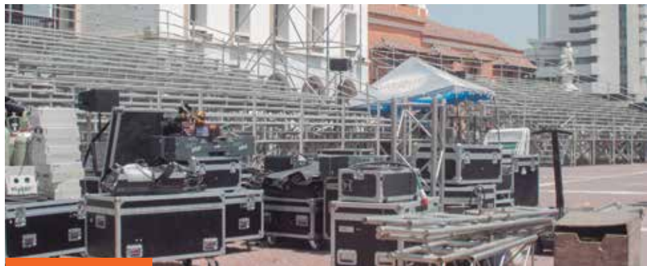
Gran montaje para la inauguración y los Premios India Catalina de la televisión.