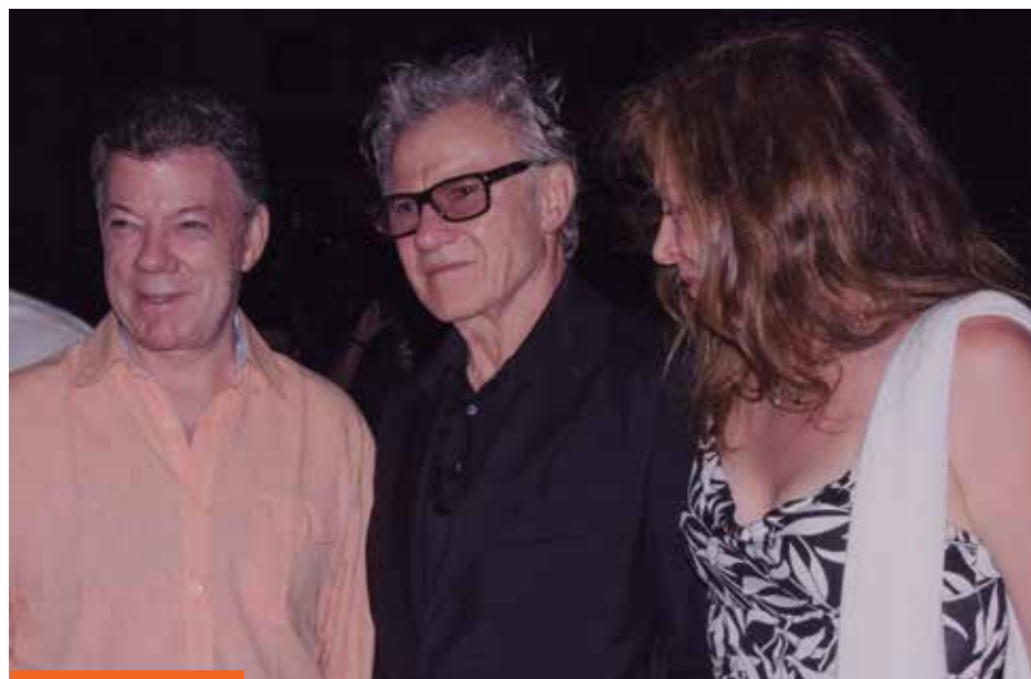
El presidente Juan Manuel Santos y Harvey Keitel en la inauguración del FICCI.