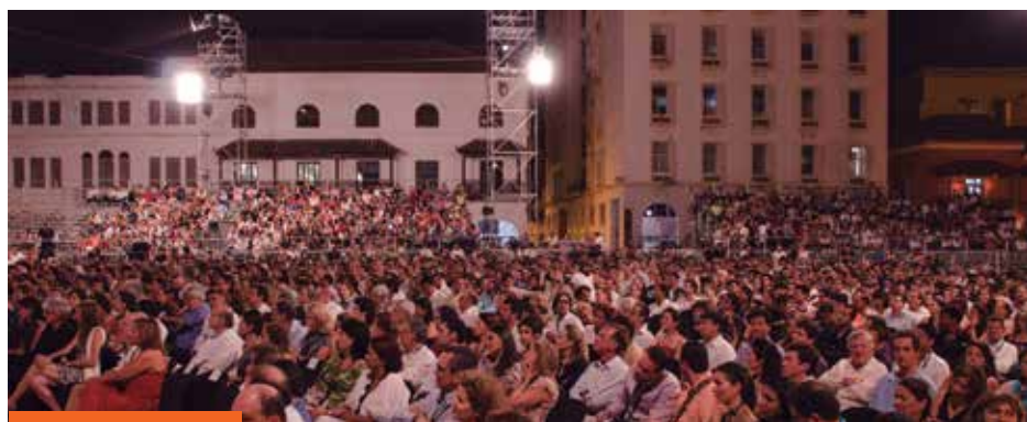
La plaza de la Aduana se llenó para ver el nuevo largometraje de Andrés Baiz.