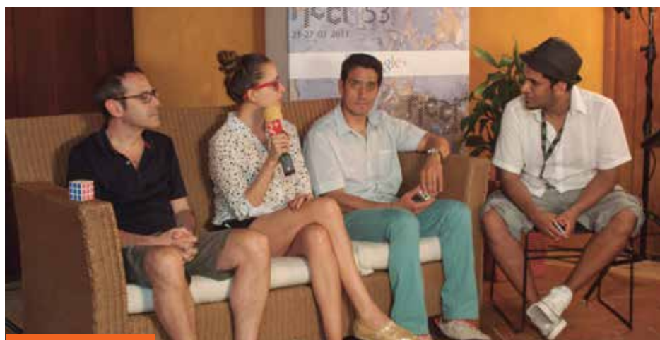
Comenzaron los hangouts de Google + FICCI, el equipo de Roa se conectó con el público.