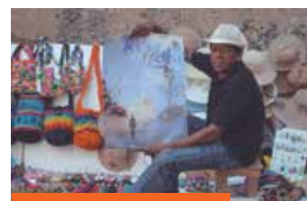
Todo el mundo en Cartagena en modo FICCI.