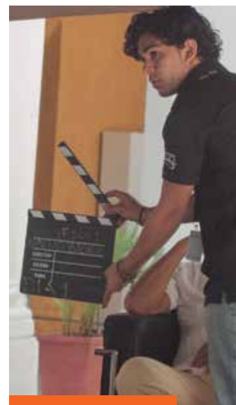
Comenzaron las pruebas en el set del Canal FICCI.